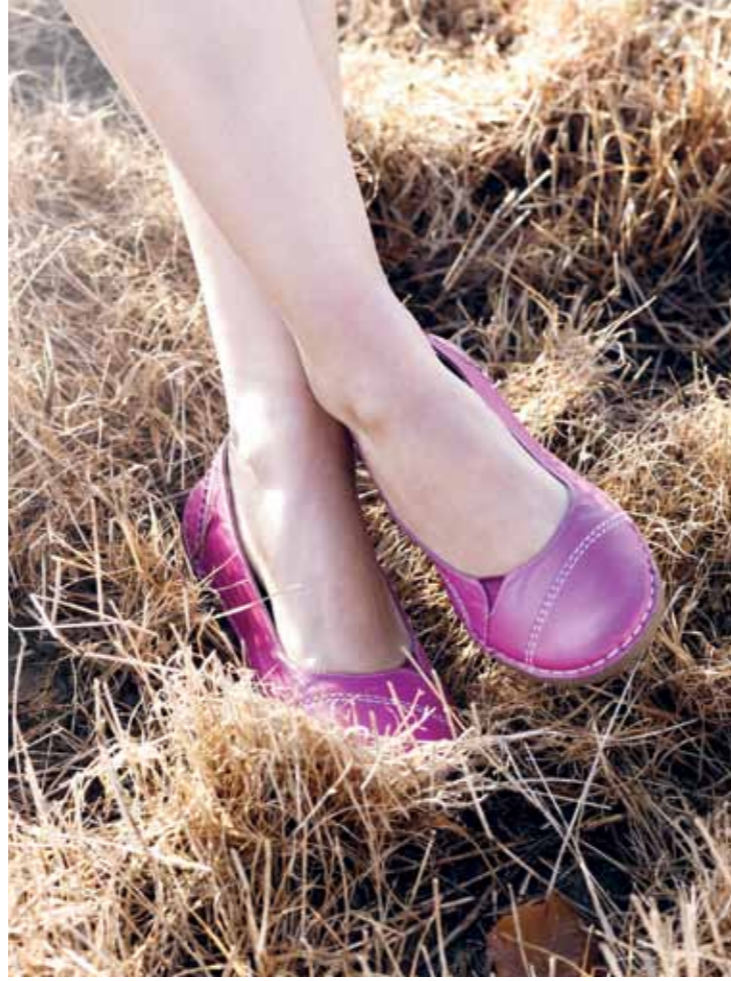
Venstre, øverst: 7128 Taja tunika 7024 Mette undertroje 368 Tørklæde Venstre, Nederst: 2914 Tinka kjole 4932 Marie bolero 7018 Crista tunika 369 Tørklæde 9023 Sko Højre: 9022 Sandal i natur-pink-sort-lime