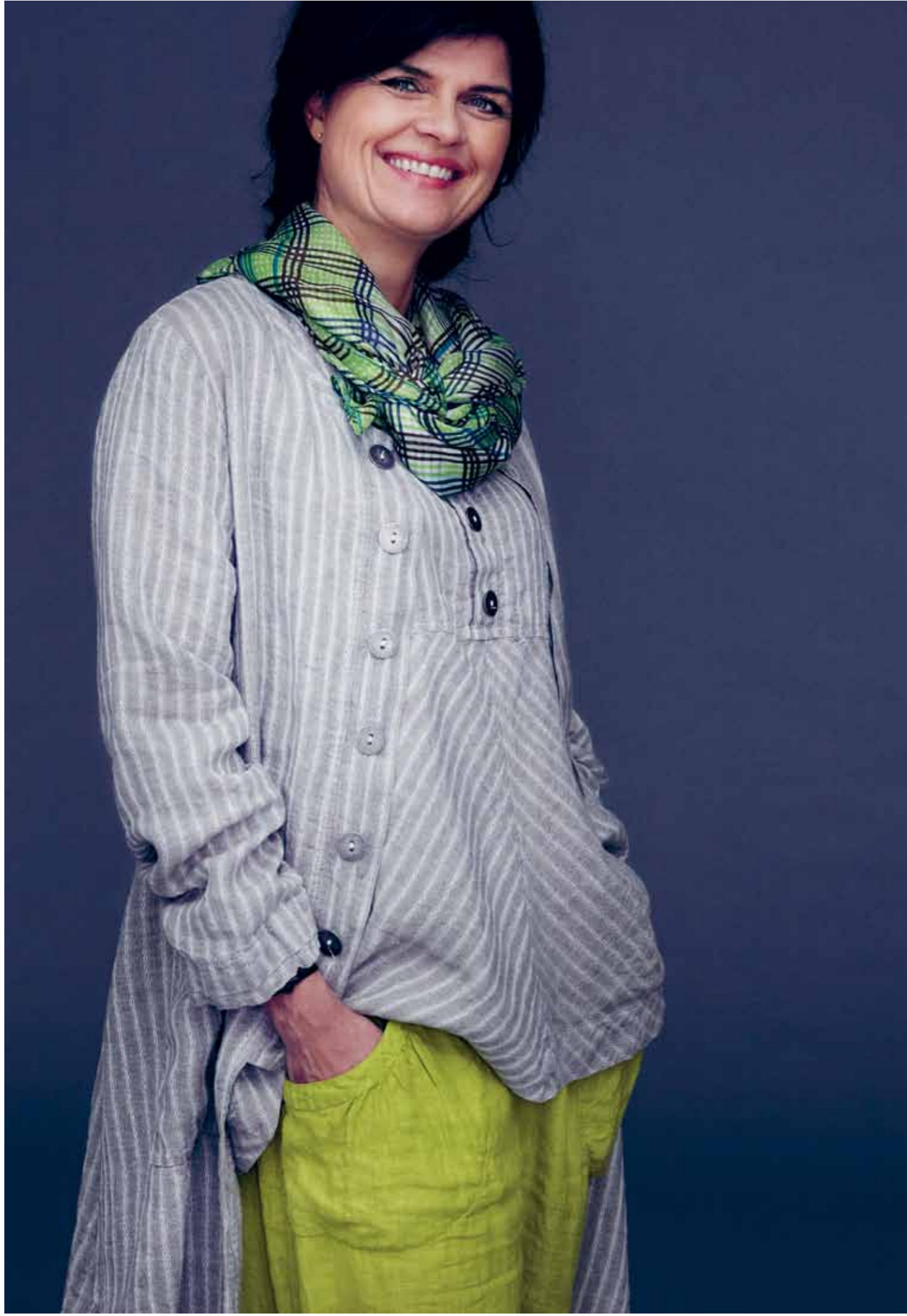
Venstre: 7984 Soffi top 7992 Soffi lang skjorte 3976 Signe st.bux 370 Torklaede Højre: 3797 Vicky.bux 7136 Mia strik 368 Torklaede 9023 Sko