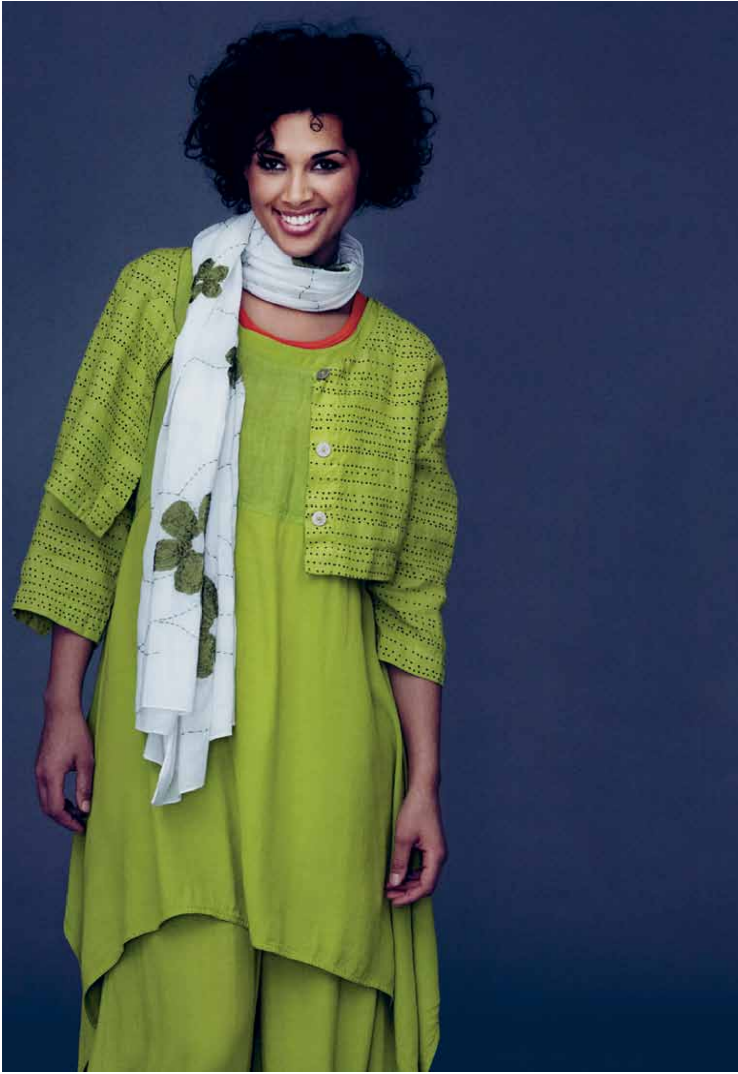
Venstre: 4938 Hulda jakke 7104 Debbie vid tunika 3985 Debbie st.bux 7024 Mette undertroje 365 Torklaede Højre: 2932 Hulda kjole 4933 Signe jakke 3976 Signe st.bux 334 Halskaede 9023 Sko