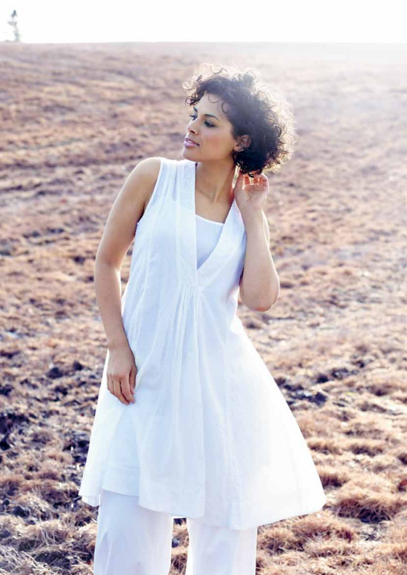
Venstre: 2901 Emily kjole m/v-hals. 3976 Signe st.bux. Højre: 7099 Terese tunika. 4929 Terese lang cardigan. 3782 Lycra bluse. 371 Tørklæde