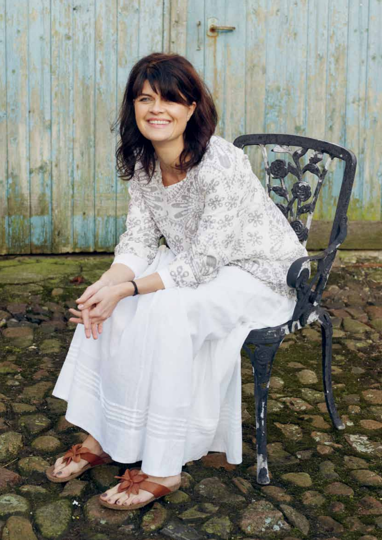
Venstre: 7131 Tinka bluse 2907 Emily nederdel 9022 Sandal Højre: 7116 Hulda vid tunika 3995 Fanny shorts 365 Torklaede