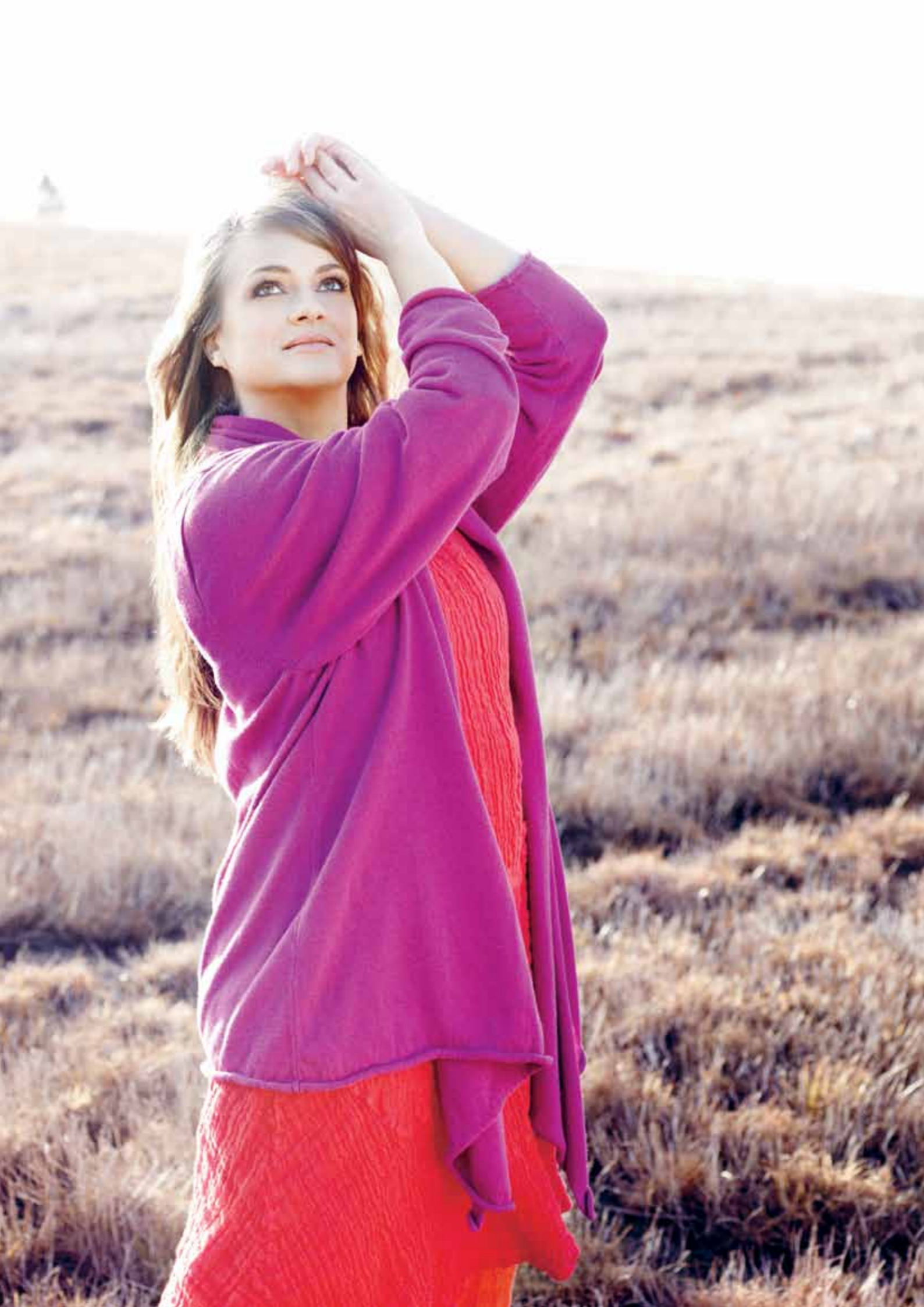
Venstre: 2918 Nulle kjole 4930 Marie cardigan Højre: 6054 Terese bred bluse 7108 Abelone tunika 3928 Lycra gamache 368 Tørklæde